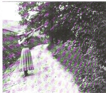
272. "TAKING A.M." By J. B. Bauer Bauer betätigte sich auf vielen Feldern, auch als Fotograf. Diese Aufnahme reichte er 1899 in der Zeitschrift „American Amateur Photographer“ ein.

tisch-verinnerlichte Lieder und Reverien ebenso wie Tanzformen der Polka, Mazurka, Walzer. „Alle interessant, reich melodisch und weise harmonisch“, urteilt Reigersberg. Das war jedoch kein Garant für kommerziellen Erfolg. Die polyphone Schreibweise und der lyrisch-versonnene Stil vieler Stücke entsprachen nicht immer dem Geschmack oder dem Können