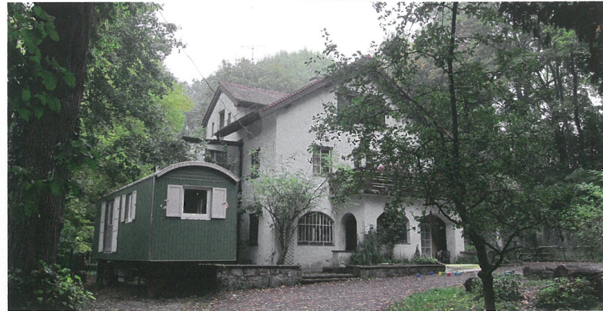
In dieser Villa in Oberföhring bei München fanden Bauer und seine Frau Unterschlupf, nachdem sie im Zweiten Weltkrieg alles verloren hatten. Hier verlebte das Ehepaar auch seinen Lebensabend.

In seiner Zeit gehörte Bauer zu der Minorität der Zither-Komponisten, welche die Zither und Streichinstrumente gleichwertig nebeneinander verwenden. Er dachte und schrieb polyphon, verteilte die Melodien großzügig über alle Einzelstimmen. Freiherr von Reigersberg schreibt zu Bauers Ensemblewerken: „In allen Werken Bauers ist kein Instrument stiefmütterlich behandelt. Jedes kann seine Eigenart entfalten und spricht seine eigene Sprache.“ Bauer bediente alle musikalischen Formen, schuf roman-