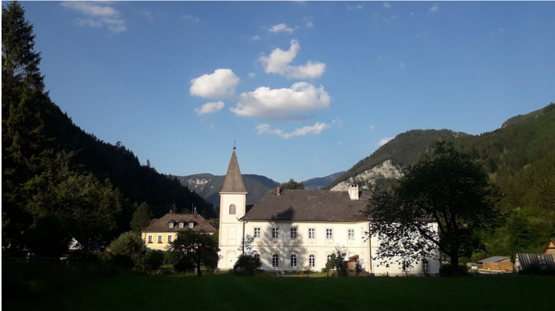
Evangelische Kirche in Nasswald, links davon der „Oberhof“, heute Wirtshaus zum „Raxkönig“, in dem schon der Dirigent Hans Richter und vermutlich auch Anton Bruckner genächtigt haben.